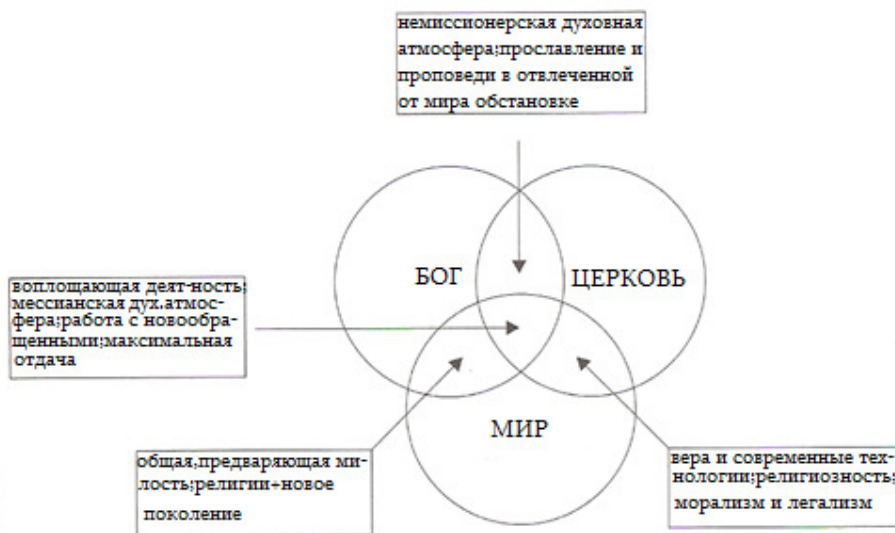
Модель взаимодействия миссионерства, воплощения, мессиянства и апостольства